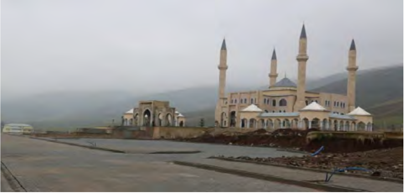
Resim 6 Sultan Muhammed Alparslan Cami

Türkiye Diyanet Vakfı tarafından yapımı üstlenilen Sultan Muhammed Alparslan Cami'sinin Peyzaj çalışmaları devam etmektedir.