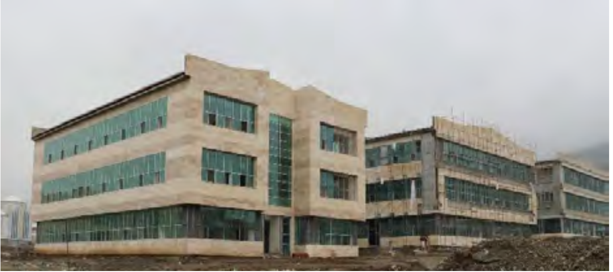
Resim 2 Fen Edebiyat Fakültesi 1'inci Etap

“Derslik ve Merkezi Birimler” projesine baęlı olarak; 2017 yılında ihalesi yapılan 14.000 m 2 kapalı alana sahip “İslami İlimler Fakültesi” yapım işinin, 2019 yılsonu itibariyle %31’i tamamlanmıştır. 4735 Sayılı Kamu İhale Sözleşmeleri Kanunu'na eklenen geçici 4'üncü Madde uyarınca feshedilmiştir.