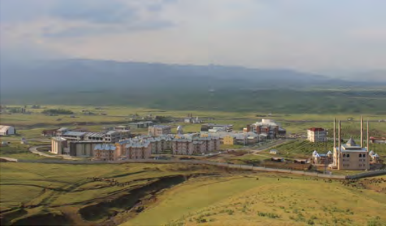
Resim 1 Külliye Alanı

“Kampüs Altyapısı” projesine baęlı olarak, 2017 yılında ihalesi yapılan “Kampüs Giriş Kapısı” yapım işinin, 2019 yılsonu itibariyle % 100’ü tamamlanmıştır. “Kampüs Altyapısı” projesine baęlı olarak, 2018 yılında yatırım programına dahil edilen “Cam Sera ” yapım işi, "Çevre Peyzaj" yapım işi ve 2019 yılında dahil edilen "Lng" yapım işi, "Trafo" yapım işi "Doęalgaz Dönüşüm" yapım işi 2019 yılı itibariyle %100’ü tamamlanmıştır. "Nizamiye Asfalt" yapım işi ise devam etmektedir.