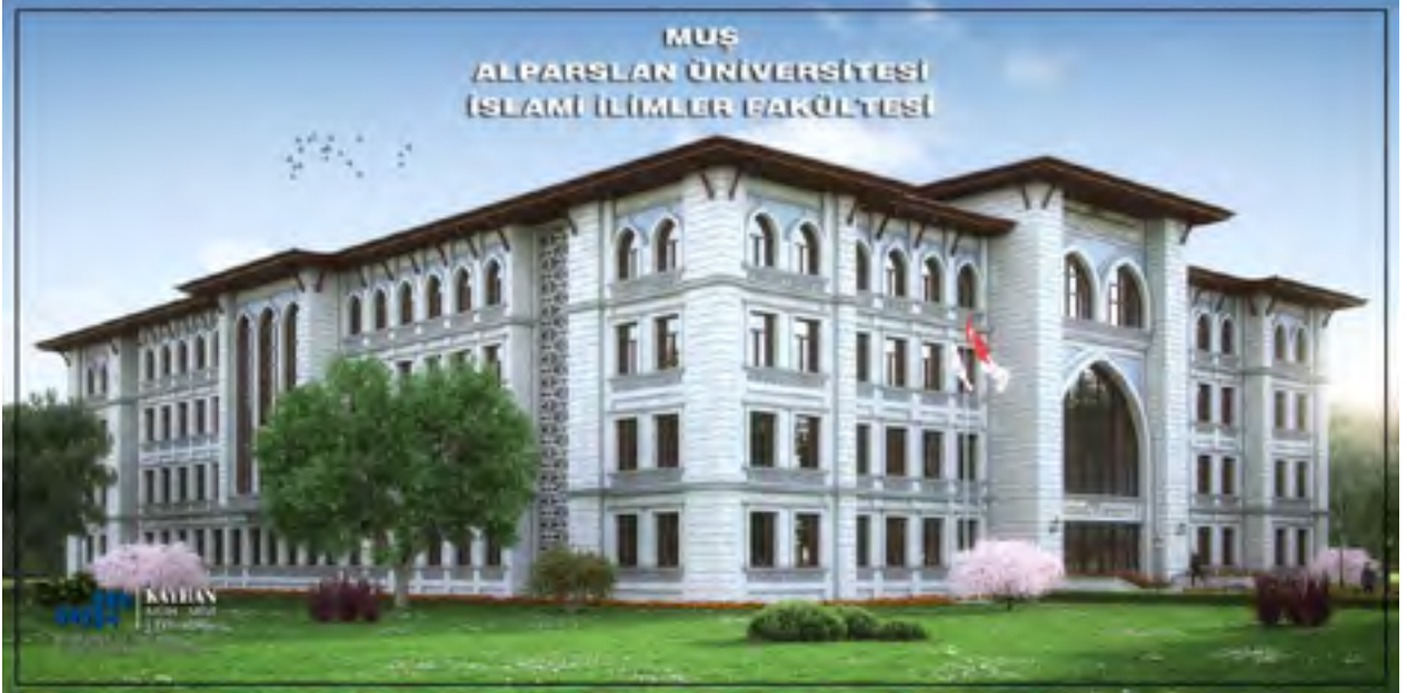
Resim 3 İslami İlimler Fakültesi

“Derslik ve Merkezi Birimler” projesine baęlı olarak; 2017 yılında ihalesi yapılan 14.000 m 2 kapalı alana sahip “İslami İlimler Fakültesi” yapım işinin, 2019 yılsonu itibariyle %31’i tamamlanmıştır. 4735 Sayılı Kamu İhale Sözleşmeleri Kanunu'na eklenen geçici 4'üncü Madde uyarınca feshedilmiştir.