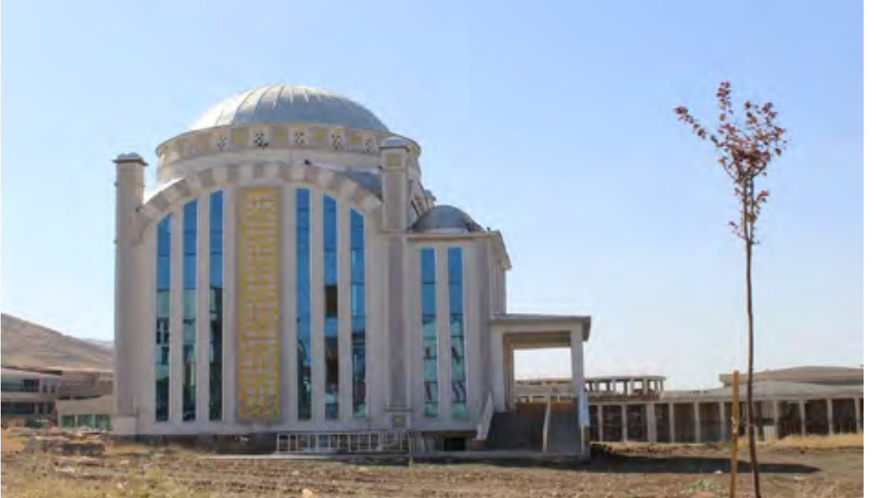
Resim 7 Gazze Cami

Muş Alparslan Üniversitesi Kalkındırma Vakfı tarafından yapımı üstlenilen Gazze Cami'sinin inşaat çalışmaları devam etmektedir.