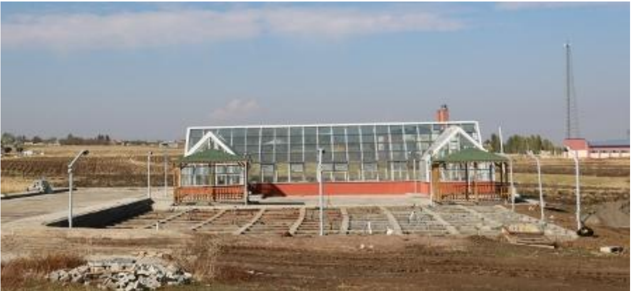
Resim 9 Cam Sera Yapım İşi

2018 yılında ihale süreci tamamlanarak yapımına başlanılan “Cam Sera” yapım işi 2019 yılsonu itibari ile tamamlanmıştır.