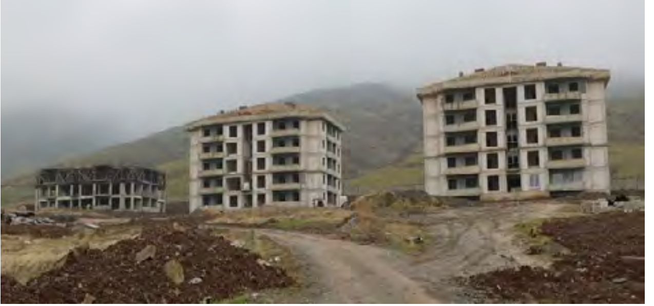
Resim 4 Lojmanlar ve Sosyal Tesisler

“Lojmanlar ve Sosyal Tesisler” projesine baėlı olarak; 2017 yılında ihalesi yapılan “Lojman (80 Daire)”nin yapım işinin 2019 yılsonu itibari ile %42’si tamamlanmıştır. 4735 Sayılı Kamu İhale Sözleşmeleri Kanunu'na eklenen geçici 4’üncü Madde uyarınca feshedildi. Yeniden ihale süreci başlatılmıştır.